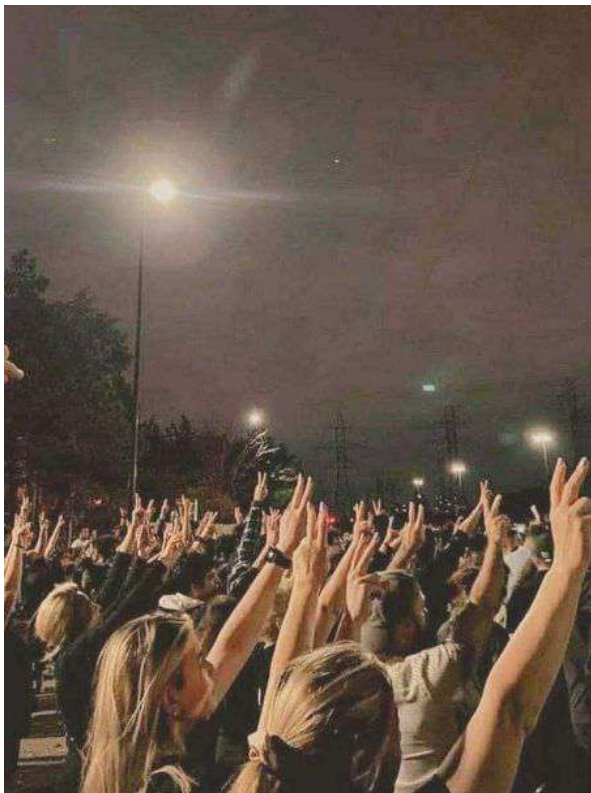
Iran - Ragazze libere dal velo

A tutto ciò la vulgata liberista oppone che il livellamento dei redditi comporterebbe una mancanza di spinta propulsiva per le aspirazioni dei singoli, aspirazioni che poi costituirebbero l'unica vera molla dell'umano progresso; ne discenderebbe anche un autentico paradiso per i furbi che tenderebbero a vivere a ca-