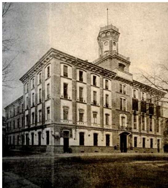
Camera del lavoro Torino